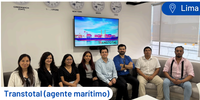
Transtotal (agente marítimo)