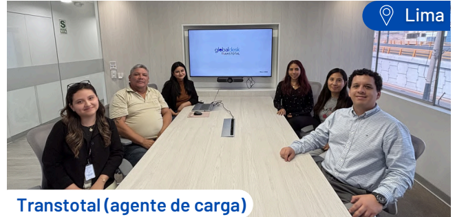
Transtotal (agente de carga)