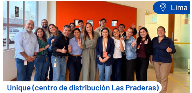
Unique (centro de distribución Las Praderas)