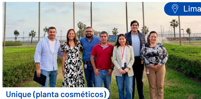
Unique (planta cosméticos)